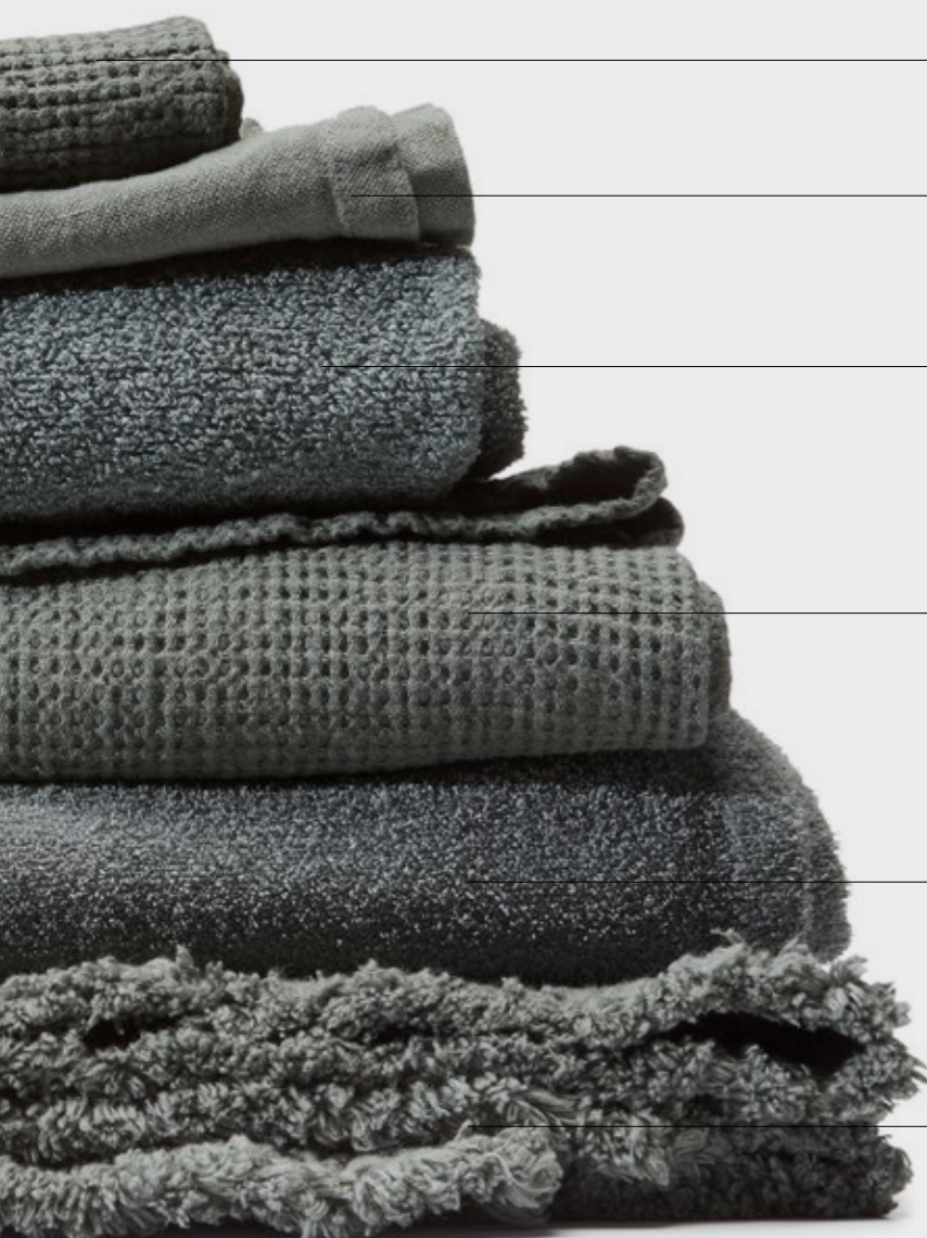
Lipe—Set di asciugamani in nido d'ape di lino