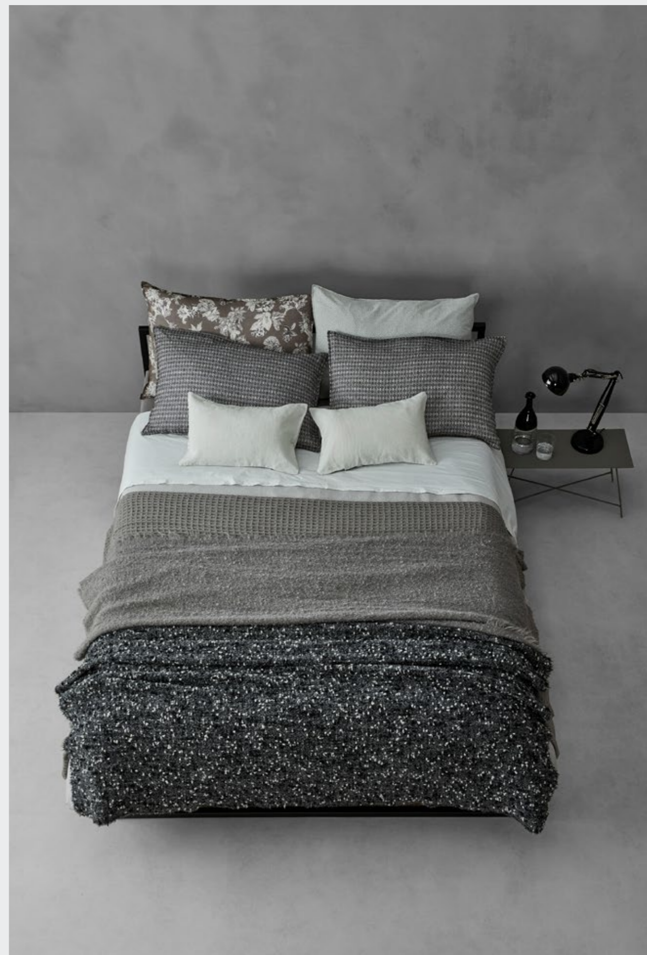
Rem —Lenzuolo in lino Nite —Lenzuolo in cotone extrafine Kash —Copripiumino in cotone e cashmere Nidone —Plaid in macro nido d'ape di lana Lam —Plaid in mohair e lana