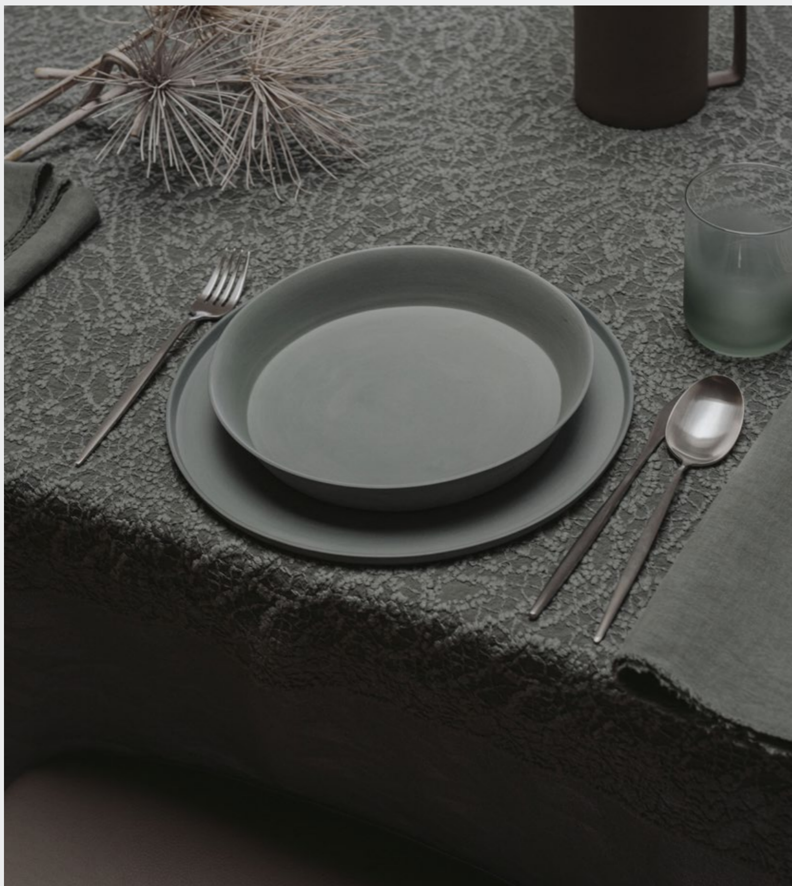
Buto—Piatto fondo in porcellana di Limoges - Design Beatrice Rossetti Buto—Piatto piano in porcellana di Limoges - Design Beatrice Rossetti