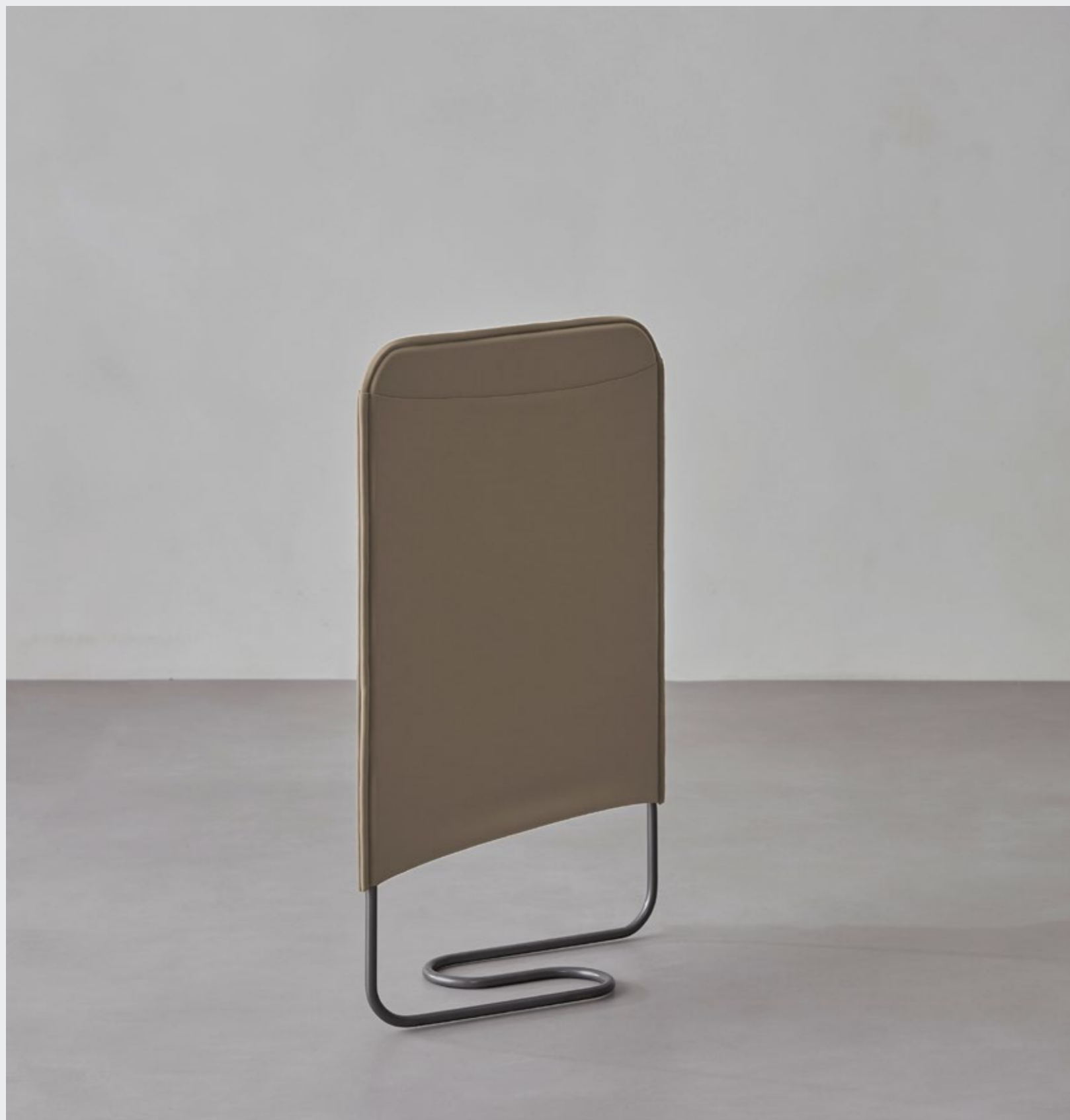
Isacco—Cesto biancheria in ferro e Melog - Design Dario Antoniali