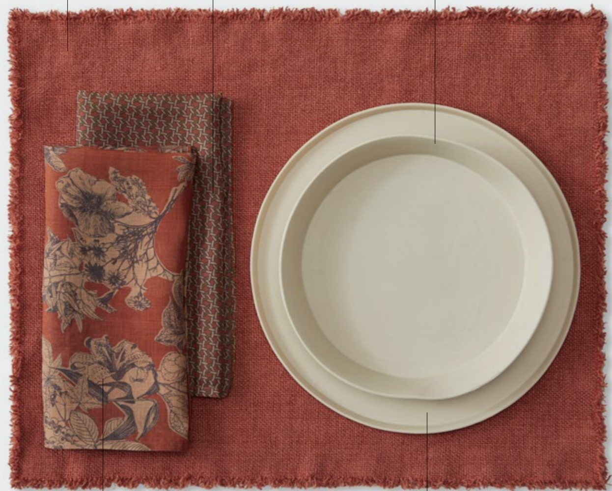
Nap Viky—Tovagliolo in ramié stampato