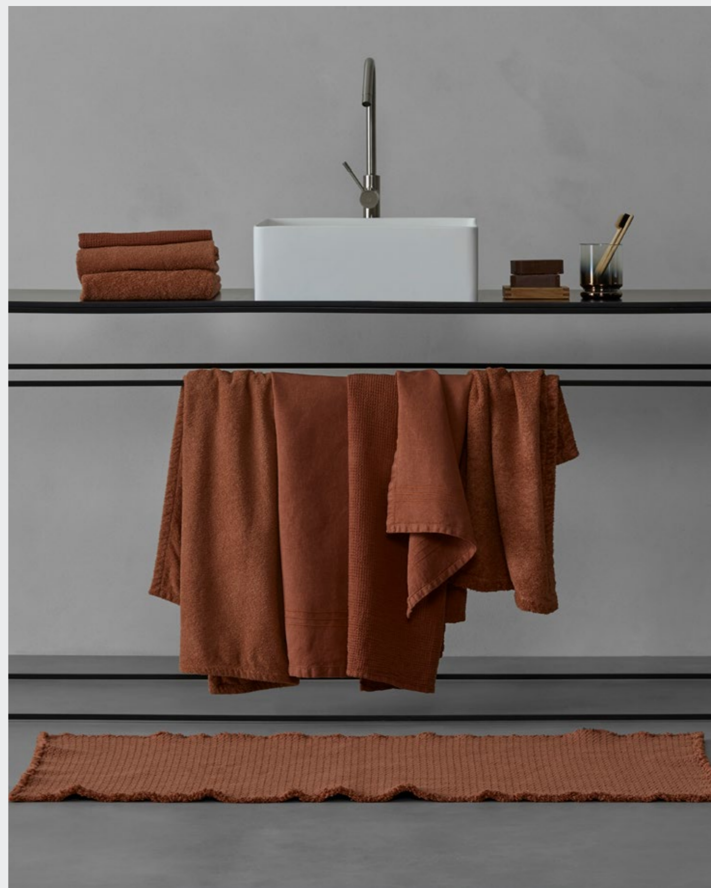
Crisp—Telo bagno in spugna di cotone