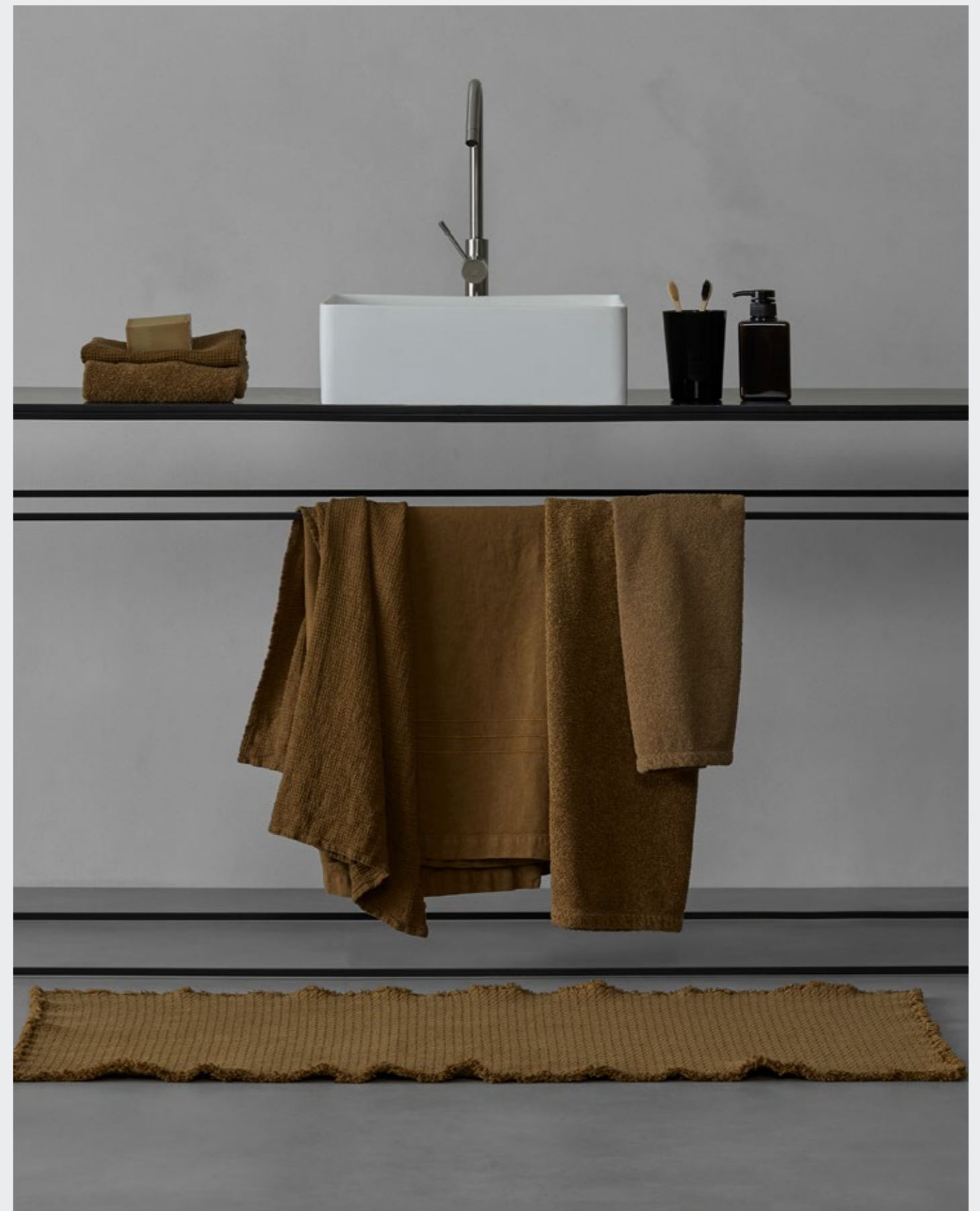
Lipe —Telo bagno in nido d'ape di lino