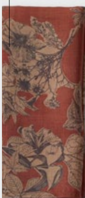
Nap Viky - 223 Marte Tovagliolo in ramié stampato