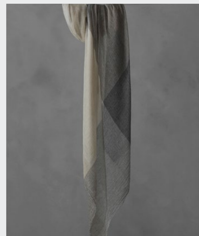
Cash—Sciarpa in cashmere