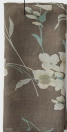
Nap Jas - 87 Fumo Tovagliolo in ramié stampato