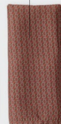
Nap Rubik - 203 Ardesia Tovagliolo in ramié stampato