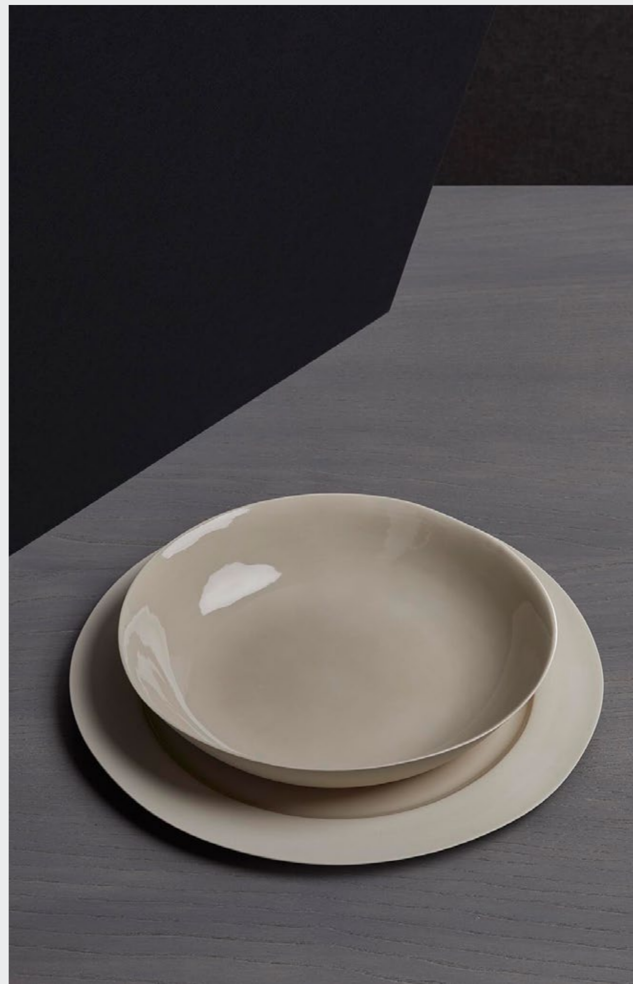
Onda—Piatto fondo in porcellana di Limoges - Design Beatrice Rossetti Onda—Piatto piano in porcellana di Limoges - Design Beatrice Rossetti