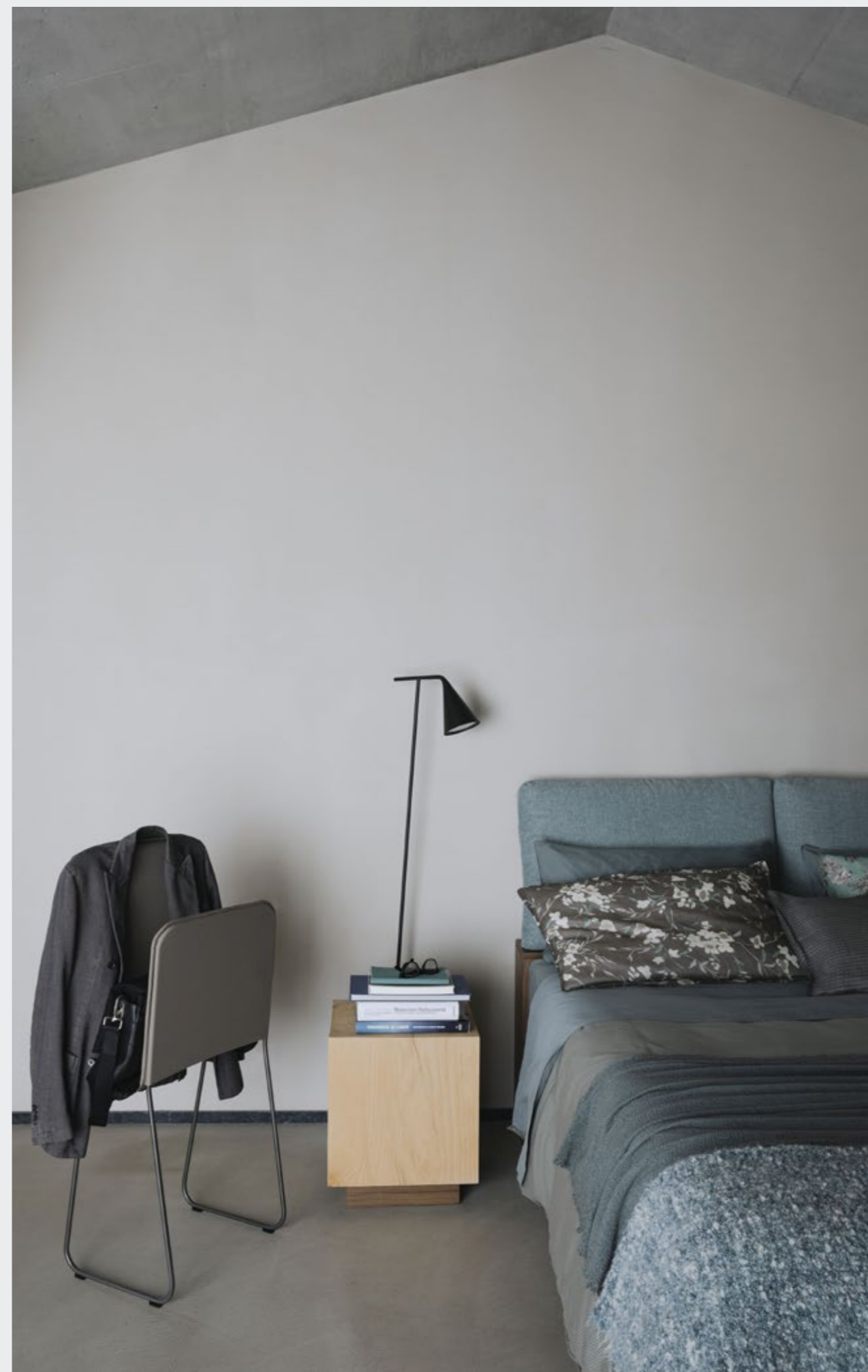
Bernardo—Servo muto in ferro e Melog - Design Dario Antoniali