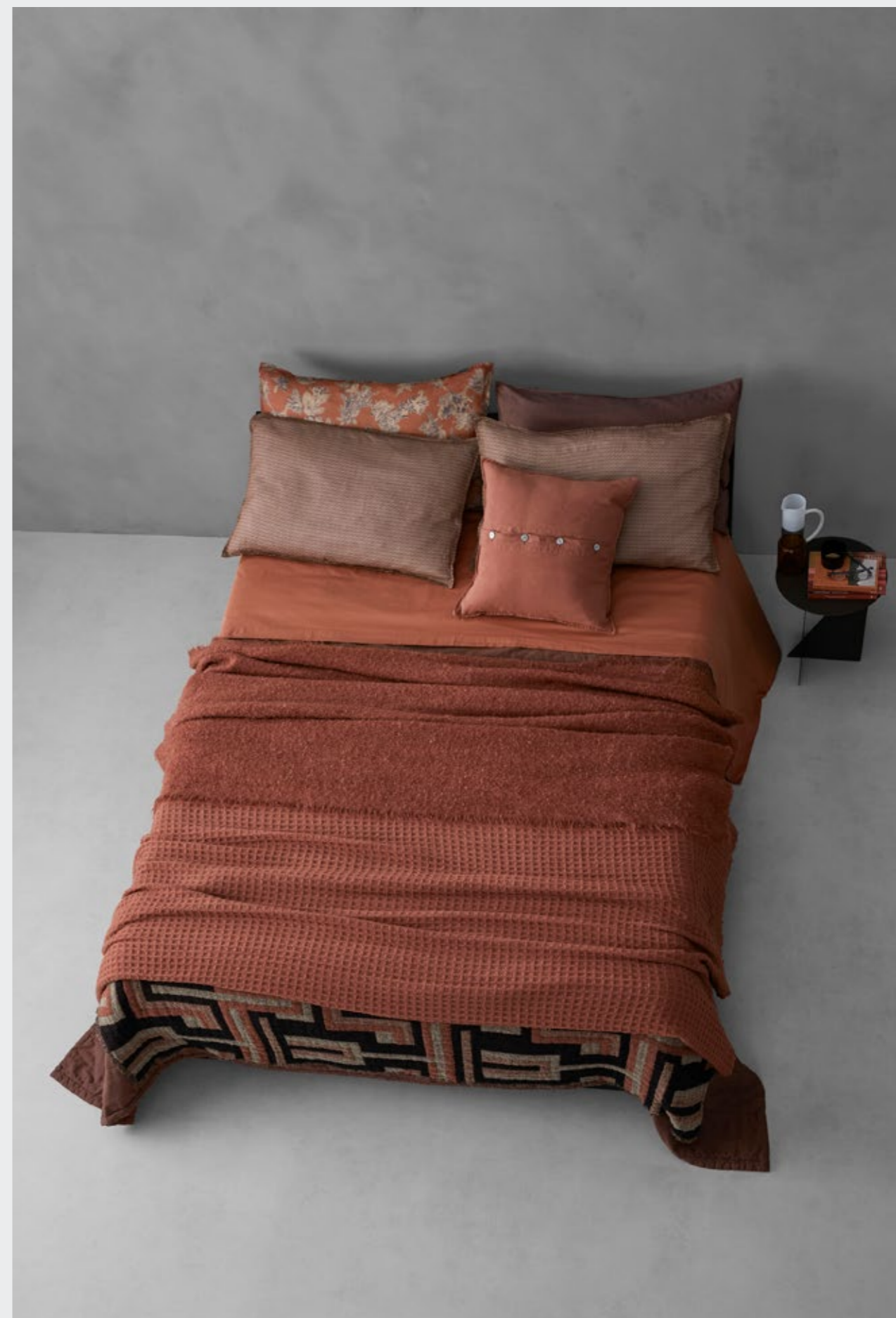
Rem—Lenzuolo in lino