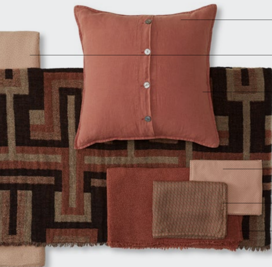
Rem—Set di cuscini in lino