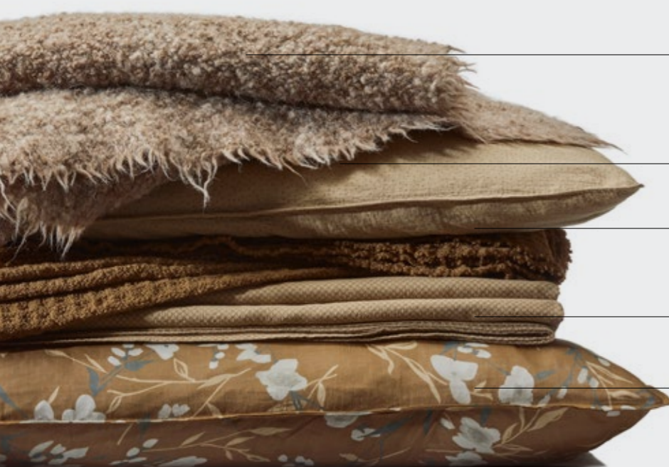
Bou —Plaid in lana e alpaca