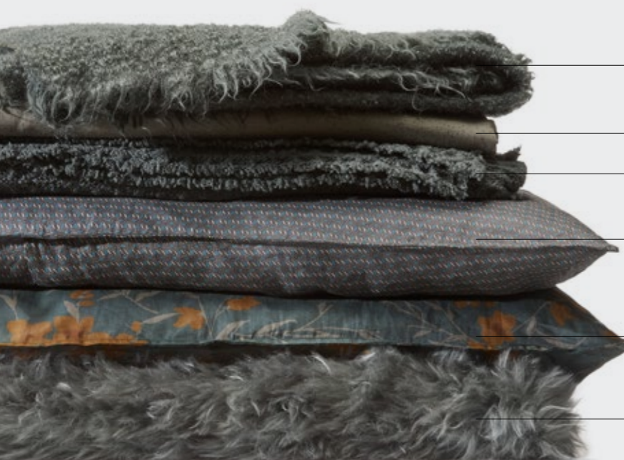
Lam—Plaid in mohair e lana