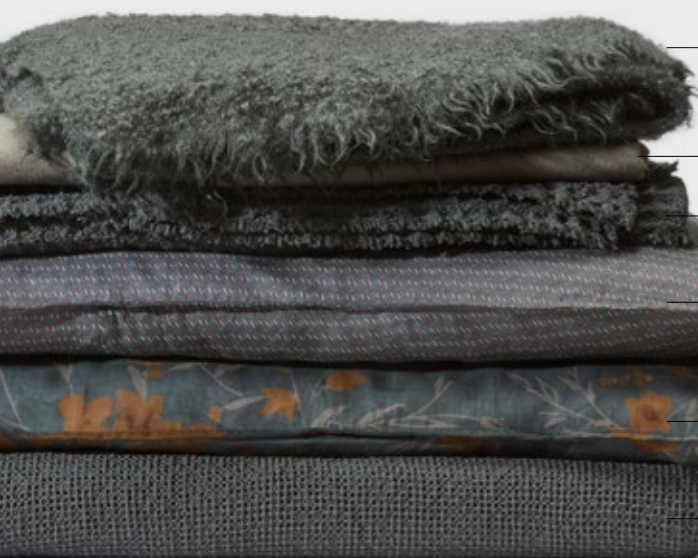
Lam—Plaid in mohair e lana