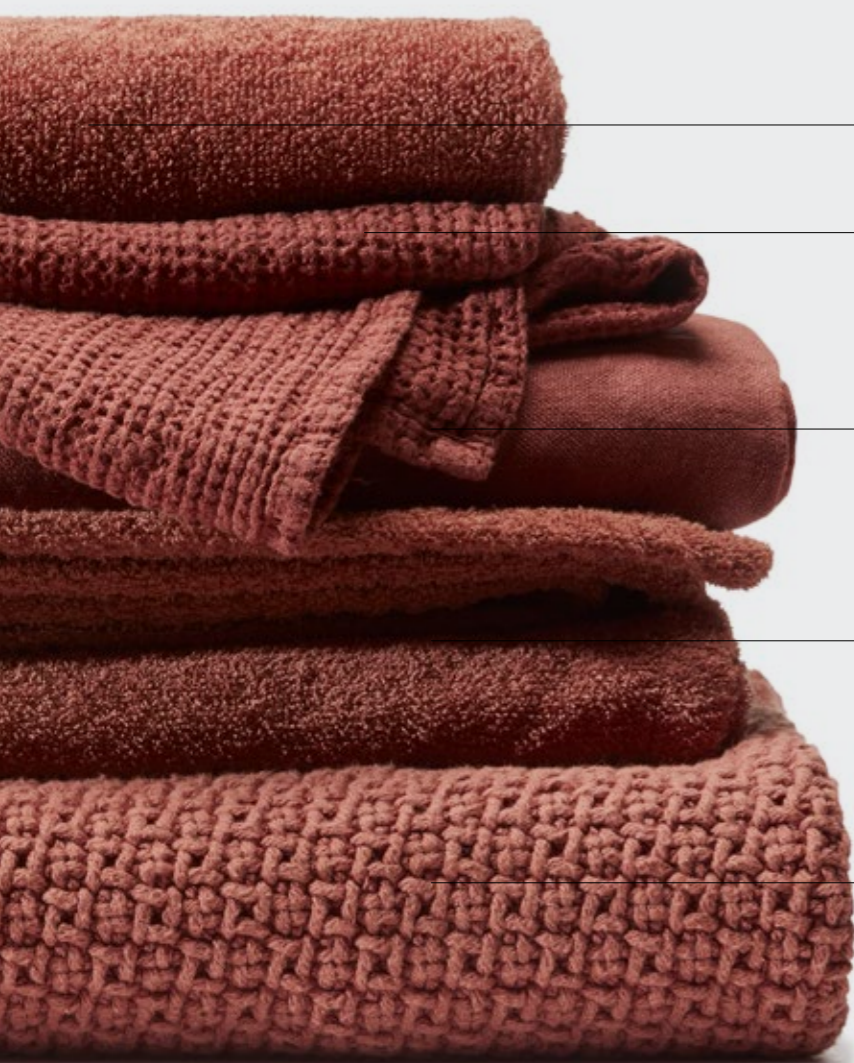
Linge—Set di asciugamani in spugna di lino