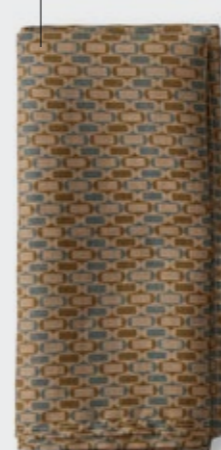
Nap Los - 222 Rosa Tea Tovagliolo in ramié stampato