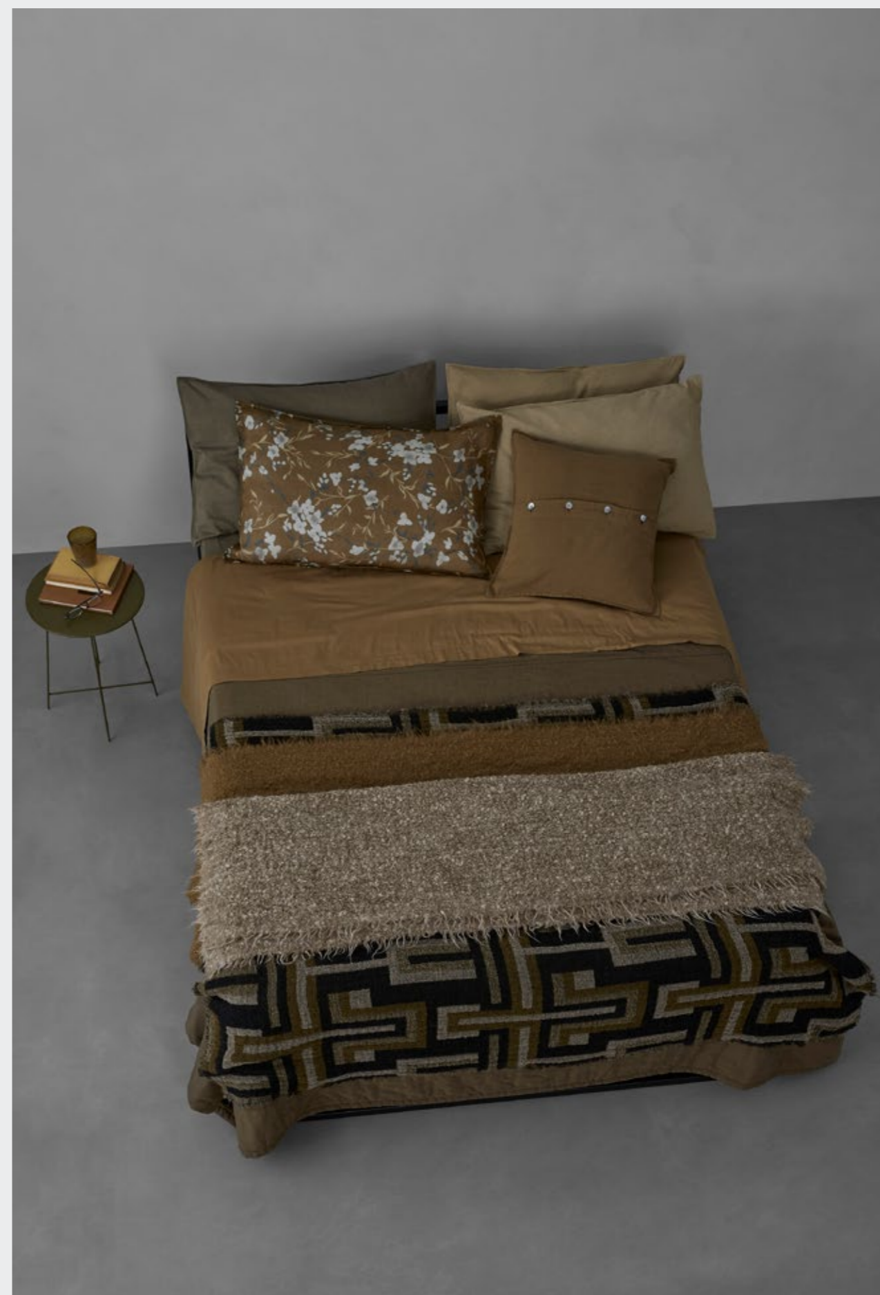
Miro —Lenzuolo in voile di cotone tubico Peach —Lenzuolo in raso di cotone Miro —Trapuntino in doppio voile di cotone Klim —Plaid in lana jacquard Lam —Plaid in mohair e lana