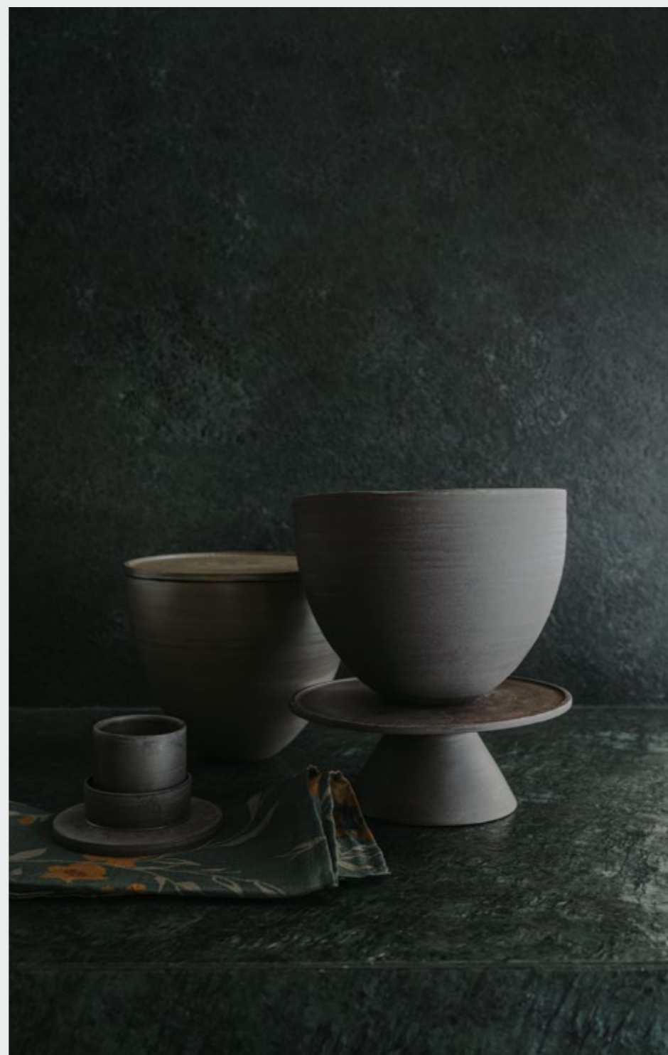
Angela—Porta mascarpone in grès - Design Martina Geroni Rosa Morada—Tazzina caffè in grès - Design Martina Geroni Nap Jas—Tovagliolo in ramié stampato