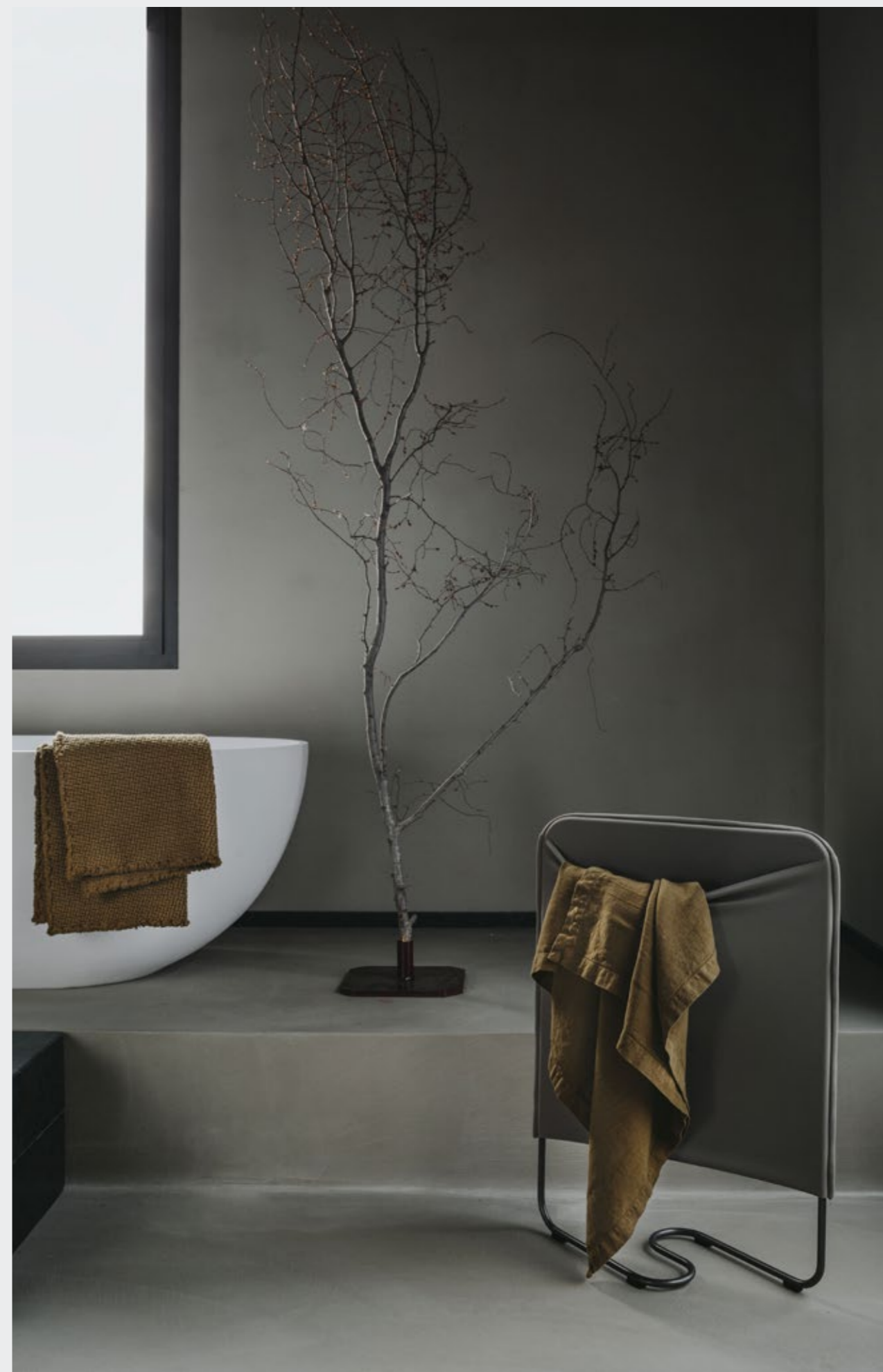
Drai New—Telo bagno in lino Molto—Tappetino in canvas di cotone