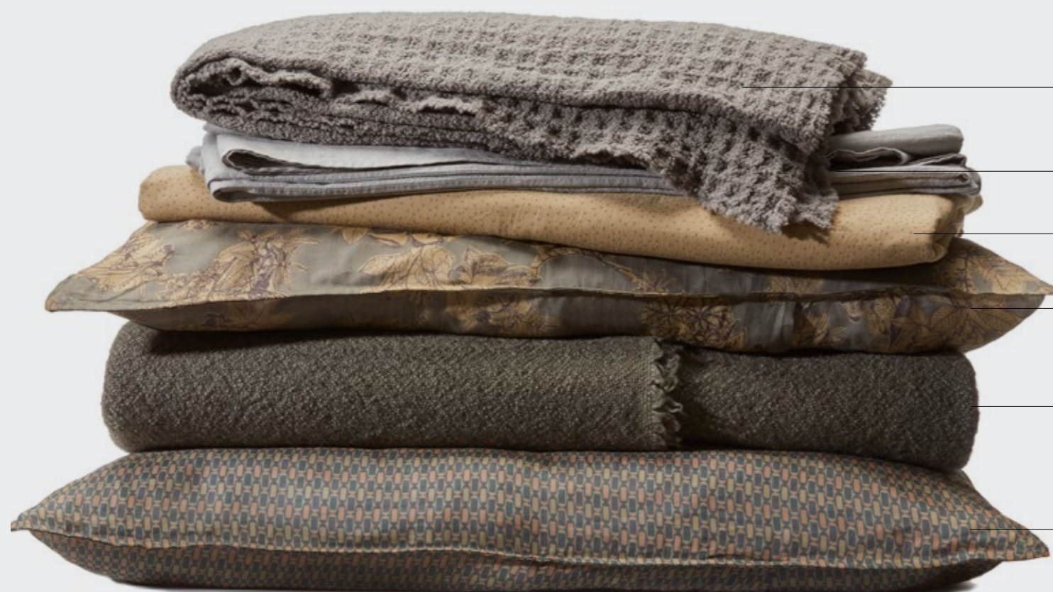
Nidone—Plaid in macro nido d'ape di lana