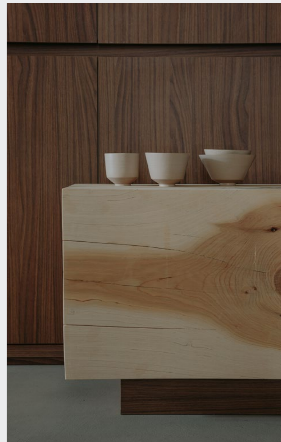
Kenta Chawan—Inverno in grès Ø 6cm, h 5,5cm - Design Martina Geroni Kenta Chawan—Autunno in grès Ø 13cm, h 8cm - Design Martina Geroni Kenta Chawan—Primavera in grès Ø 11cm - 17 cm, h 3cm - Design Martina Geroni Kenta Chawan—Estate in grès Ø 11cm - 17 cm, h 3cm - Design Martina Geroni