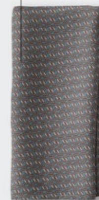
Nap Chains - 193 Ottanio Tovagliolo in ramié stampato