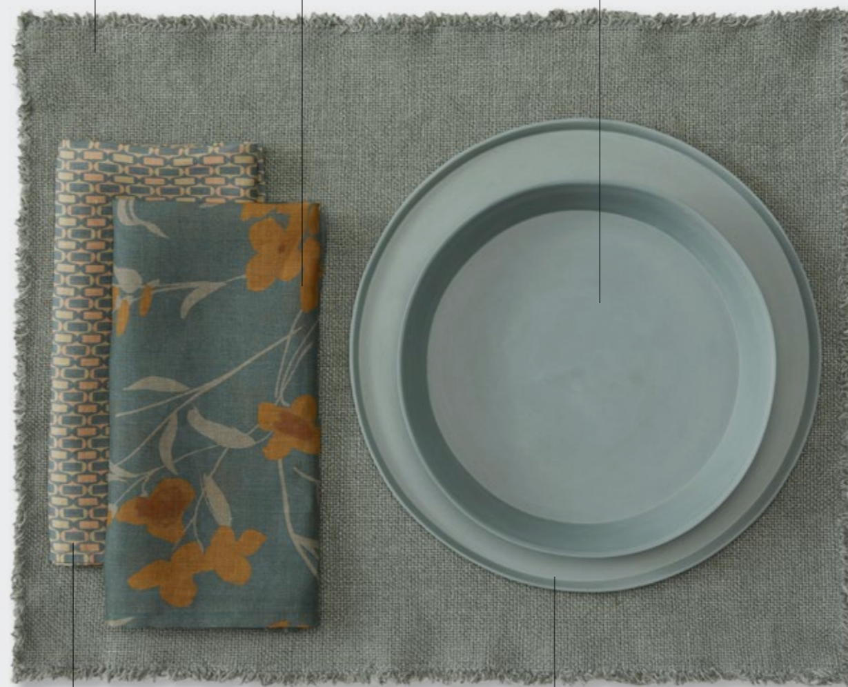
Nap Los—Tovagliolo in ramié stampato