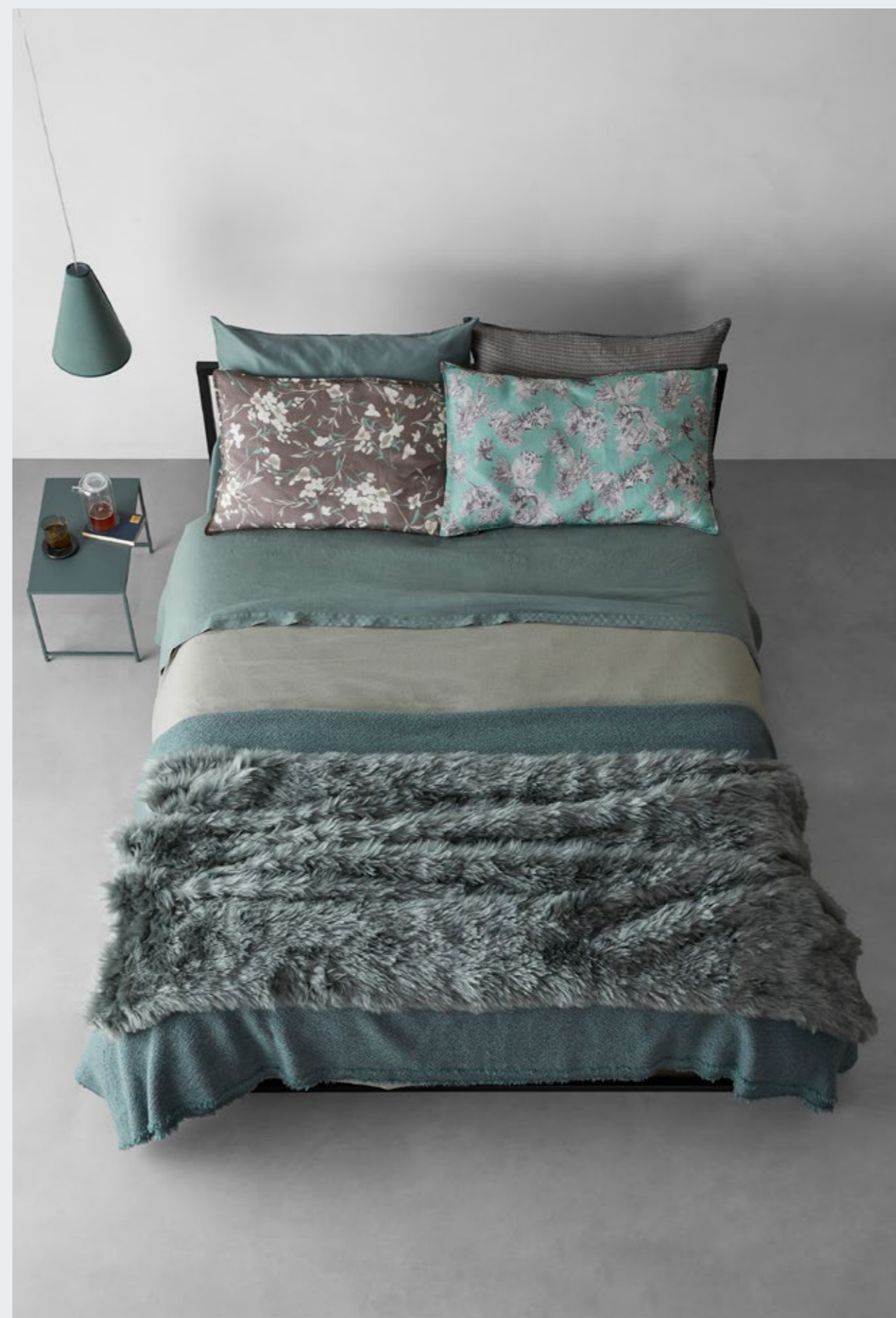
Peach—Lenzuolo in raso di cotone