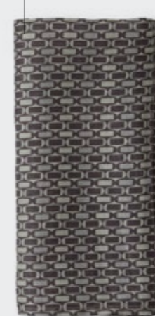
Nap Los - 225 Crab Tovagliolo in ramié stampato