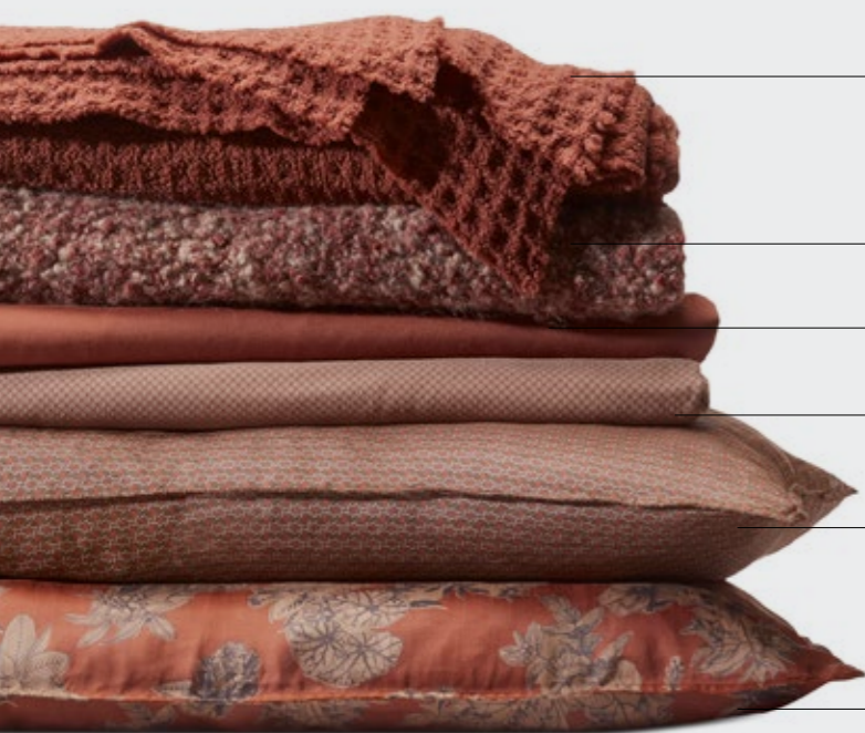
Nidone—Plaid in macro nido d'ape di lana