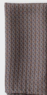
Nap Rubik - 203 Ardesia Tovagliolo in ramié stampato