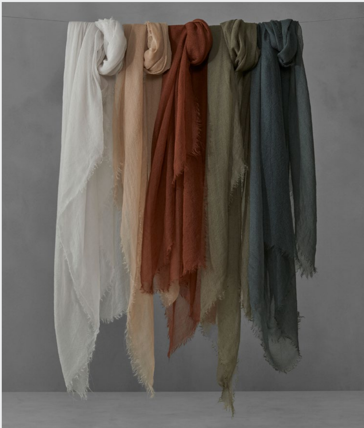
Mohair—Sciarpa in mohair