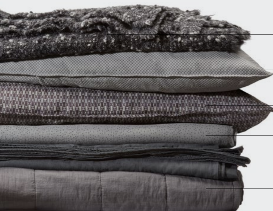
Bou —Plaid in lana e alpaca