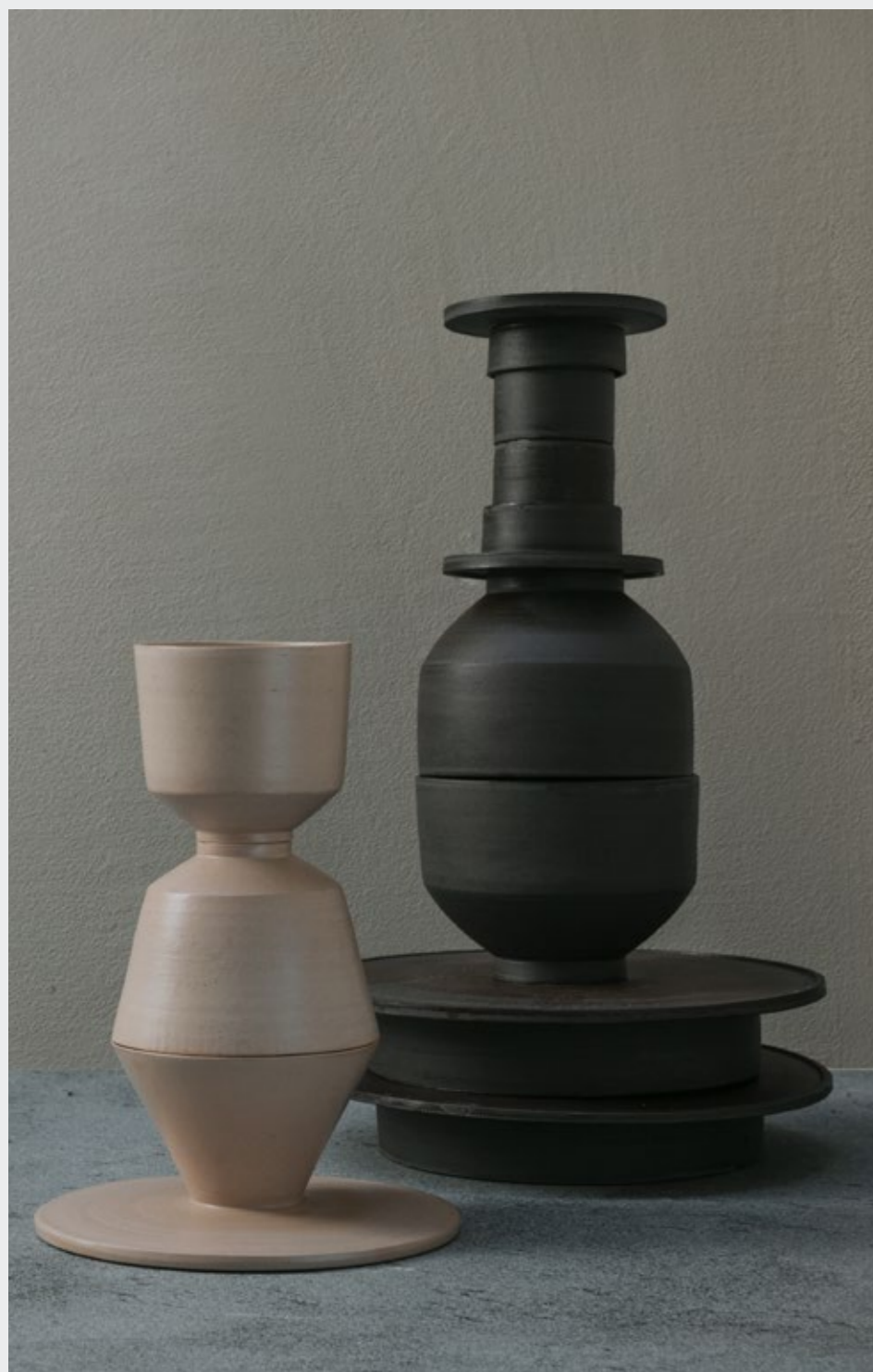
Angela—Porta mascarpone in grès - Design Martina Geroni Rosa Morada—Tazzina caffè in grès - Design Martina Geroni Rosa Morada—Ciotola in grès - Design Martina Geroni Rosa Morada—Piatto/ciotolina in grès - Design Martina Geroni Rosa Morada—Piatto fondo e piano in grès - Design Martina Geroni Kenta—Chawan in grès