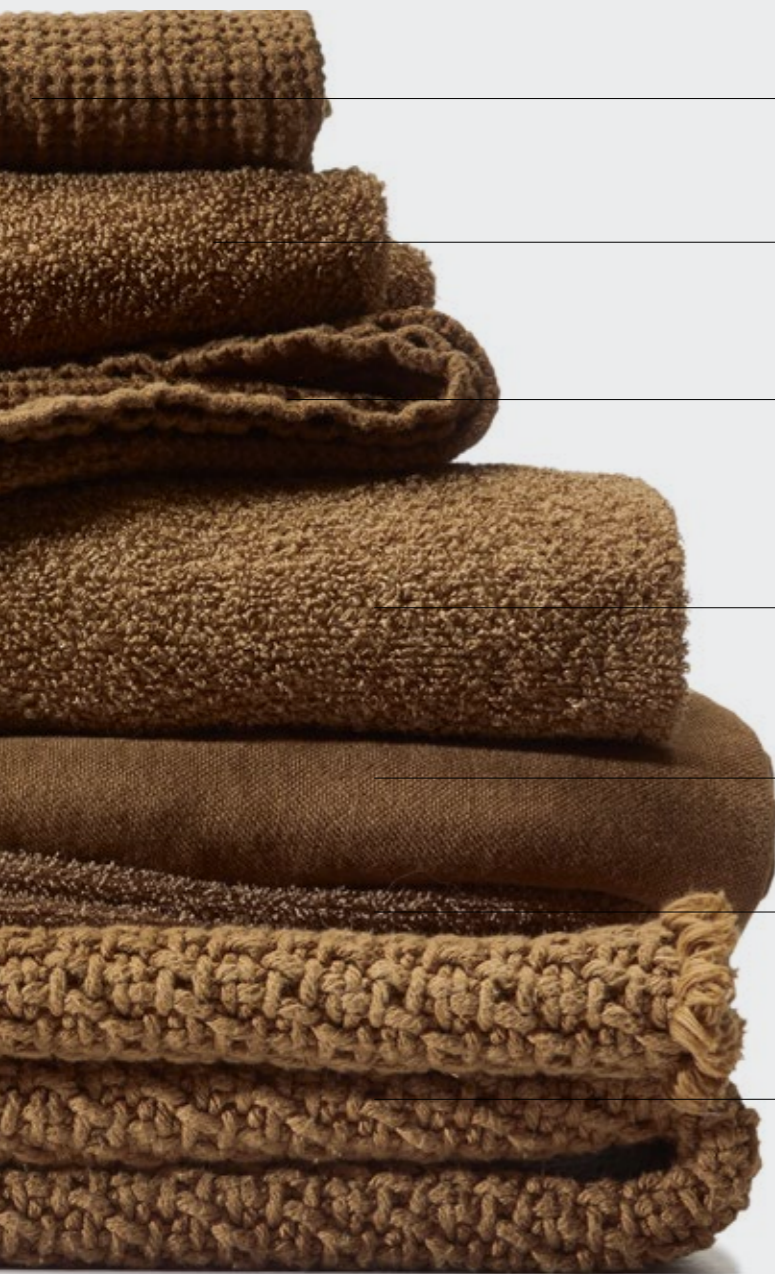
Lipe —Set di asciugamani in nido d'ape di lino