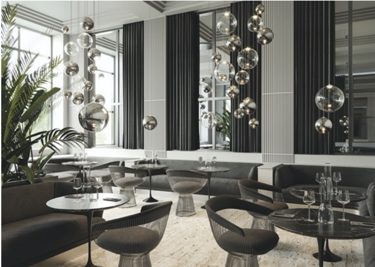
Random Solo by Chia Ying Lee © Studio Italia Design

Disegnata da Chia-Ying Lee, Random Solo evolve il design dell'attuale collezione Random separando l'originale cluster a tre elementi e aggiungendo due nuove lampade sferiche in vetro soffiato.